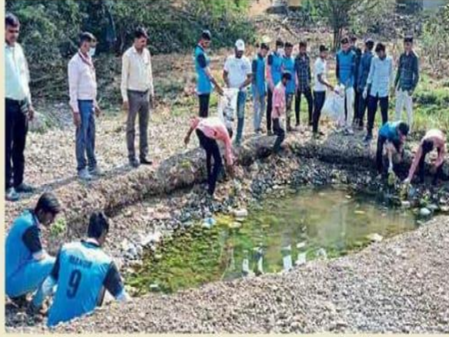
कळवण : बेहडी नदी संवर्धन उपक्रमांतर्गत नदीपात्रात स्वच्छता करताना विद्यार्थी.