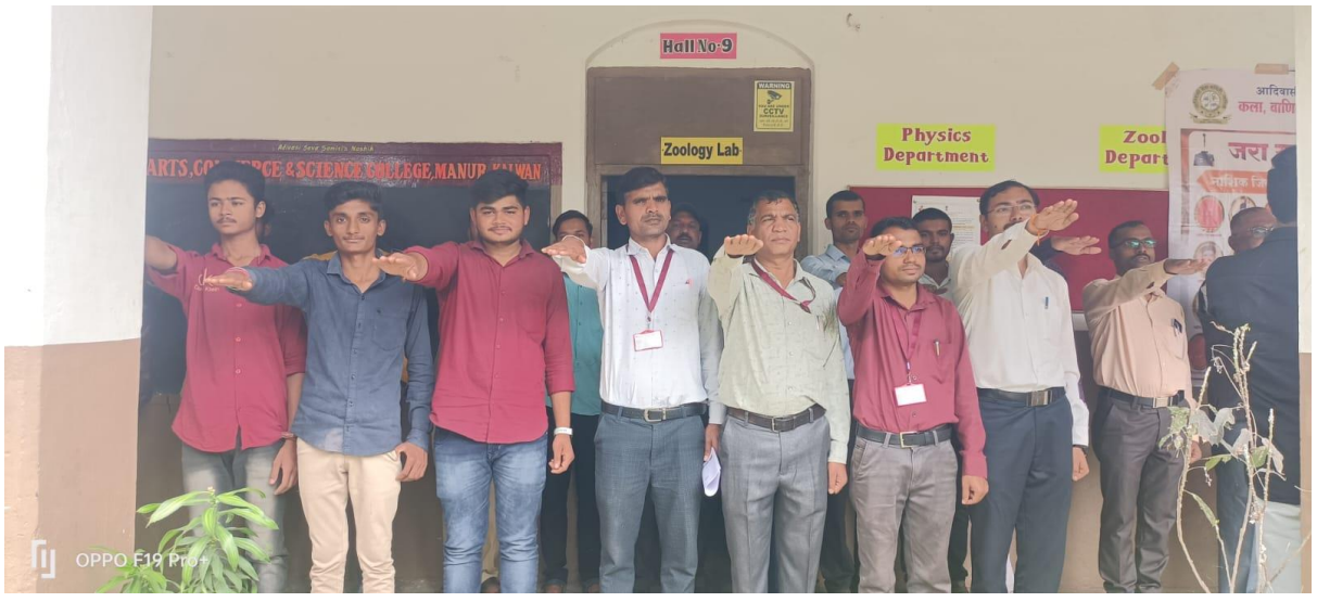
‘पंच प्रण शपथ’ घेताना महाविद्यालयाचे प्राध्यापक व स्वयंसेवक