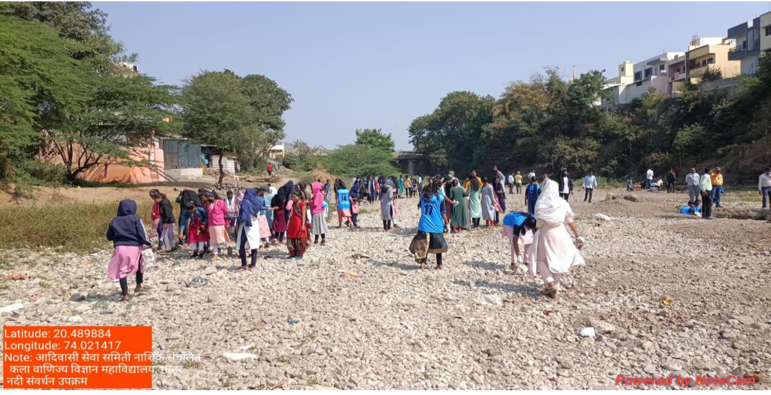
बेहडी नदीपात्रातील शेवाळ, प्लास्टिक व इतर केरकचरा जमा करतांना विद्यार्थी व विद्यार्थिनी