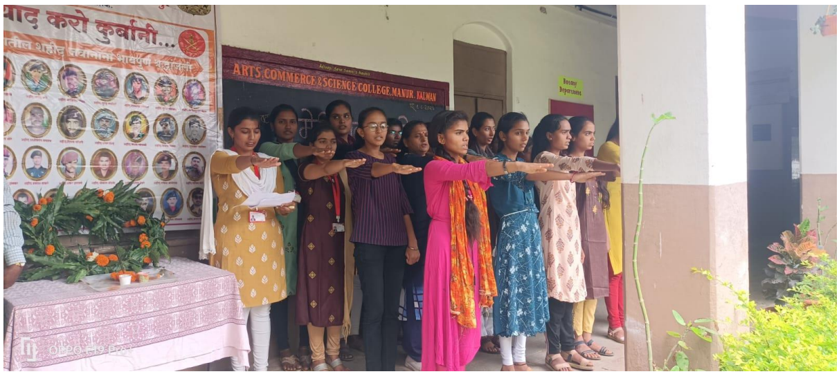
‘पंच प्रण शपथ’ घेताना महाविद्यालयाचे प्राध्यापिका व स्वयंसेविका