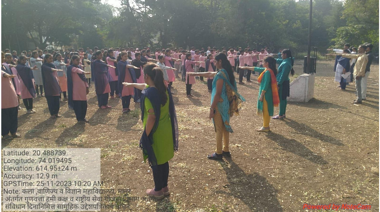
संविधान दिनाच्या उद्देशपत्रिका वाचन करतांना महाविद्यालयाचे विद्यार्थी व प्राध्यापक