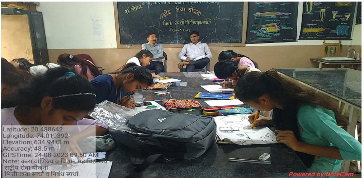
भितीपत्रके स्पर्धामध्ये सहभागी स्पर्धक